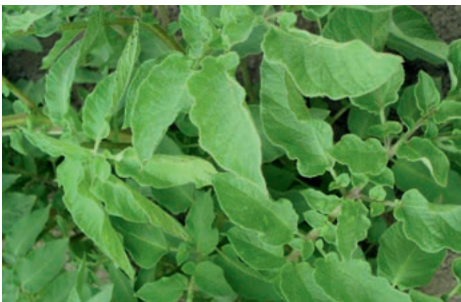
Bild 1: Behaarte Blätter und überlagerndes Blattwerk erschweren die Pflanzenschutzanwendung: MYKO-TOP bringt den Wirkstoff sicher an das Ziel

MYKO-TOP gewährleistet eine optimale Verteilung und Anhaftung von Fungiziden auf der Blattoberfläche.