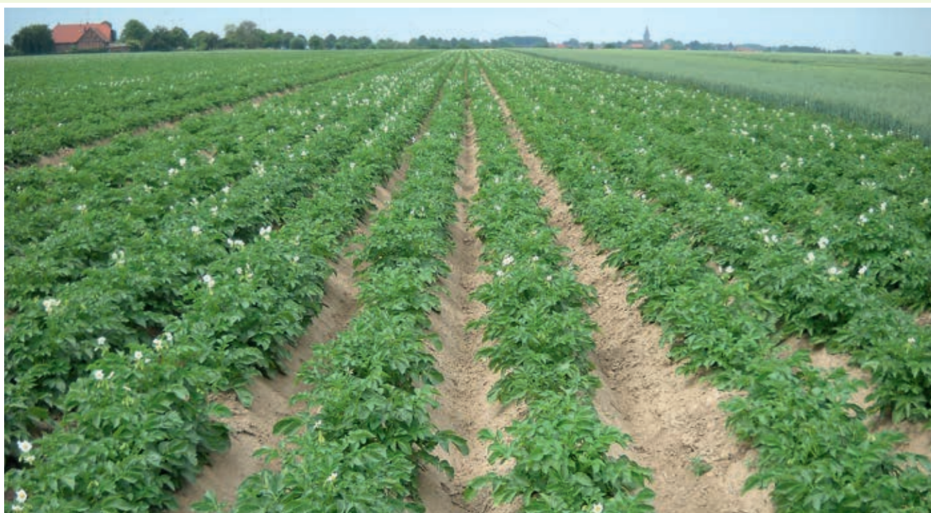
Bild 2: Gesunder Kartoffelbestand ohne Blattkrankheiten: MYKO-TOP stabilisiert den Fungizidbelag und unterstützt die Wirkung der Fungizide

▶ MYKO-TOP bringt mehr Wirkstoff auf Blatt und Stängel, für effiziente Spritzfolgen mit maximalem Erfolg.